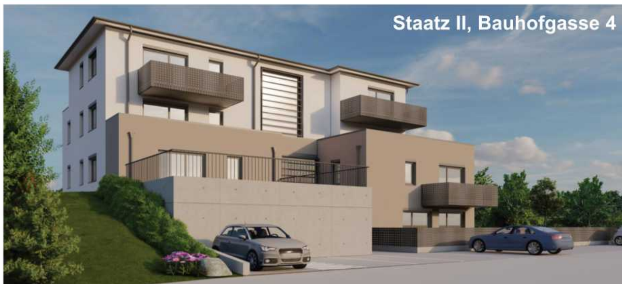
Staatz II, Bauhofgasse 4