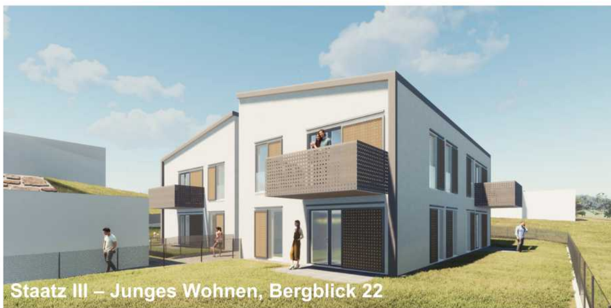
Staatz III – Junges Wohnen, Bergblick 22