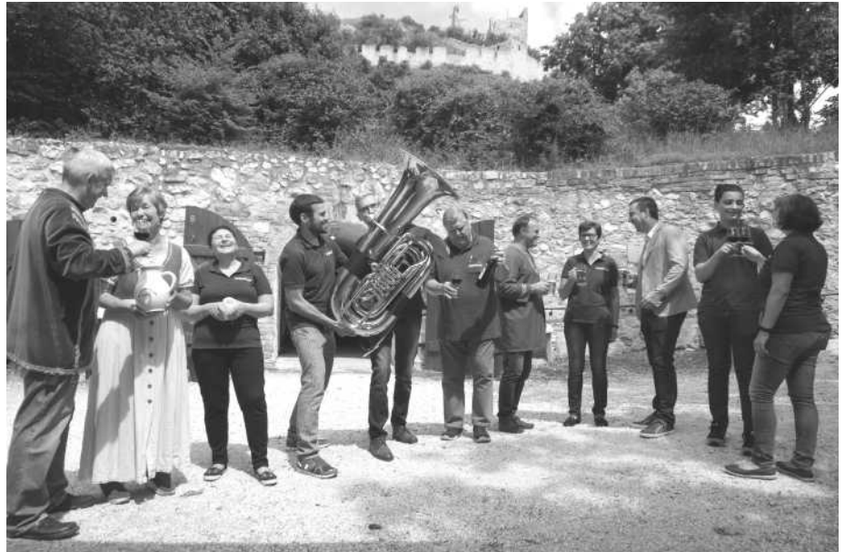
Foto: Das Kulturzentrum eröffnet Heurigen, Kulturvermittlung und Ausstellungen.

Während der Öffnungszeiten des Heurigen werden im Schlosskeller einige Ausstellungen gezeigt: Die Mittelalter-Ausstellung über die Entstehung