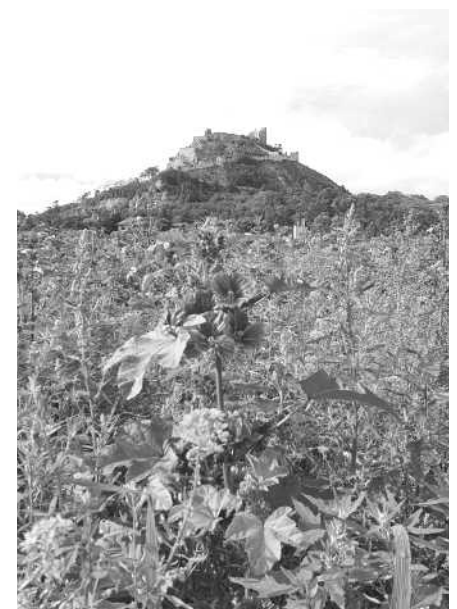
Foto: ein Blick in eine Bienen-Weidenwiese am Fuss des Staatzer Berges.

Heimische Pflanzen sind an unsere klimatischen Verhältnisse gut angepasst und brauchen in der Regel keine nährstoffreichen Böden. Wer Kräuter für die Küche oder Naschhecken anpflanzt, verzichtet aus eigenem Interesse ohnehin auf einen derartigen Einsatz.