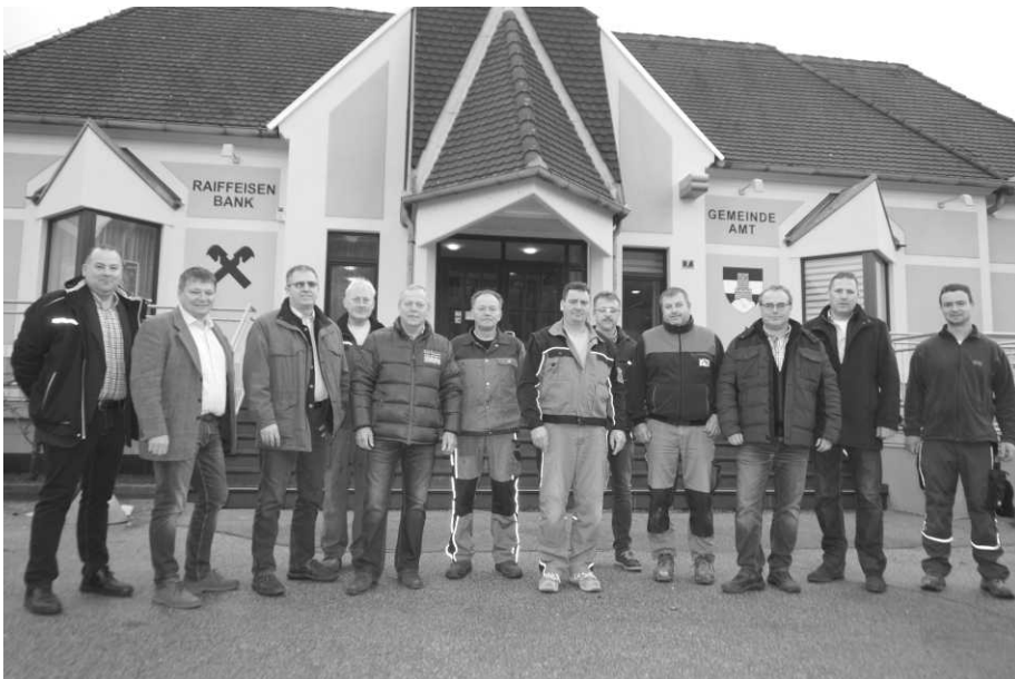
Foto: Für die Sanierung des Gemeindeamtes Staats wurden vor allem regionale Firmen und die Mitarbeiter des Staatzer Bauhofes herangezogen

Kurz vor Winterbeginn konnte das große Sanierungsprojekt des Gemeindeamtes abgeschlossen werden, die erste nach 38 Jahren und somit eine Notwendigkeit.