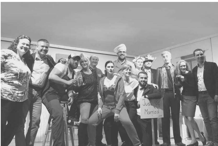
Foto: Die Theatergruppe Staatz unterhielt im Herbst mit einer humorvollen Abrechnung der Wirtshauszene.

Eine humorvolle Abrechnung mit der Wirtshaus-Szene brachte die Staatzer Theatergruppe im Herbst auf die Bühne: „Blunzengröstl statt Kaviar“ erzählte von den Bemühungen einer Wirtin, aus ihrem heruntergekommenen Beisl ein Nobelrestaurant zu machen. Die Darsteller, die sich mit Akribie und Hingabe in ihre Rollen eingelebt hatten, sorgten gelungener Situationskomik für viel Vergnügen und großes Gelächter im Publikum. Eine weitere Schar von Helfern sorgte auch für eine kulinarische Unterhaltung der Besucher.