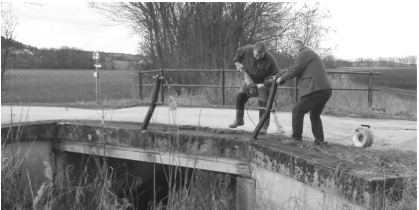
Foto unten: Zerstörtes Brückengeländer an der Feldbrücke in Enzersdorf